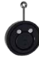
CLAPET ANTI-RETOUR SANDWICH