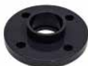
BRIDE AVEC COLLET FIXE PVC