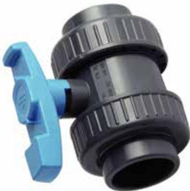
VANNE A COLLER DOUBLE RACCORD