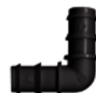
COUDE EN PE