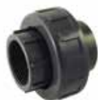
RACCORD UNION MIXTE PVC