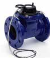
COMPTEUR D'EAU A IMPULSIONS