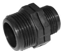
MAMELON REDUIT EN PE