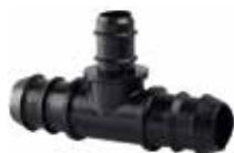
TE REDUIT EN PE