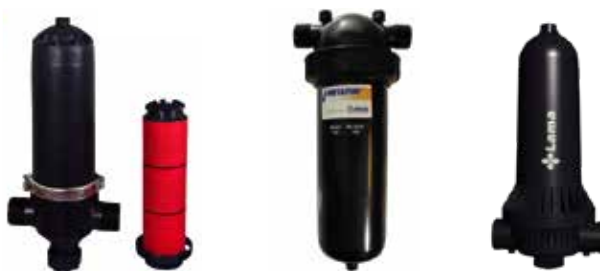
FILTRE A DISQUE VERTICAL