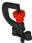
MICRO - ASPERSEUR