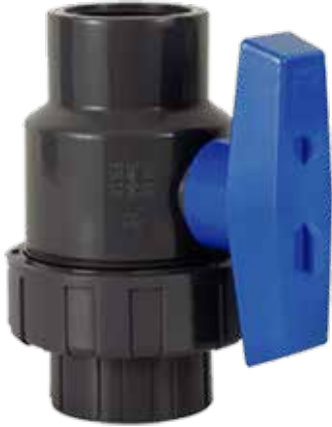
VANNE A COLLER SEUL RACCORD