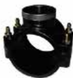
COLLIER DE PRISE EN CHARGE