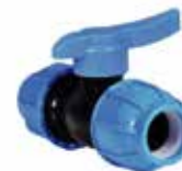
VANNE DOUBLE RACCORD