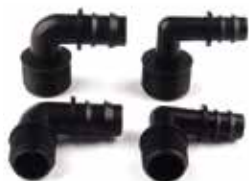
COUDE FILETE EN PE