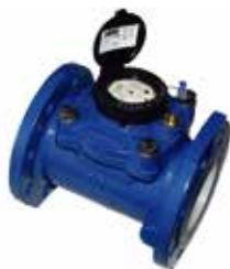
COMPTEUR D'EAU WOLTMAN