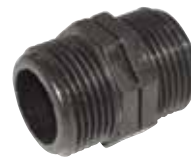
MAMELON EN PE