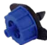
* GOUTTEUR RAMBO