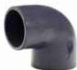
COUDE A COLLER PVC 90°