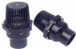
CLAPET CREPINE A COLLER