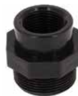
REDUCTION F/M FILETE