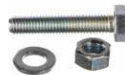
BOULON AVEC ECROU