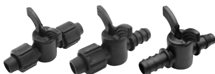
VANNETTE EN PE